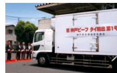
神戸ビーフ タイ国初輸出出発式

食肉等の製造・卸売事業においては、引き続き生産事業の拡充に取り組んでおり、豚については生産事業・設備の規模拡大に着手しております。牛については平成24年1月に初めて神戸牛