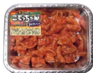
こてっちゃん 旨辛コチジャン味

食肉等の小売事業においては、新規ダイベロッパーとの取り組みによる出店や既存店活性化活動の継続、提案型販売の強化等を進めました。