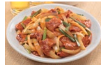
こてっちゃん 旨辛コチジャン味 調理例

食肉等の小売事業においては、新規ダイベロッパーとの取り組みによる出店や既存店活性化活動の継続、提案型販売の強化等を進めました。