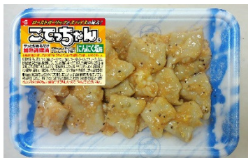
盛り付けイメージ

岩塩の味わい深さとにんにくのコク深い旨みが特長の塩味タイプのこてっちゃんです。さらに隠し味に赤唐辛子を使用することで、スパイス感と彩りをアップしました。