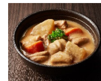
盛り付けイメージ