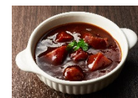
盛り付けイメージ