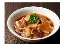
盛り付けイメージ