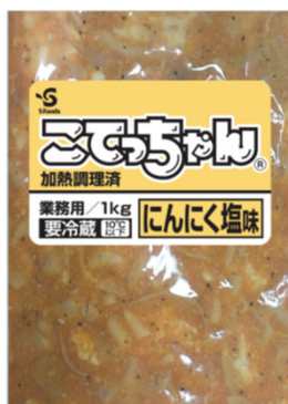
業務用パッケージ